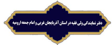
دقتر نمایندگی ولی فقیه در استان آذربایجان غربی و امام جمعه ارومیه