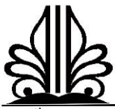
کانون قرآن و عترت دانشگاه آفاق